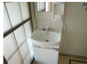
* 図面と現況に相違がある場合は現況を優先します。

■ 再契約時には敷金・礼金が新たにかることはありません。再契約料 20,000円(税別)