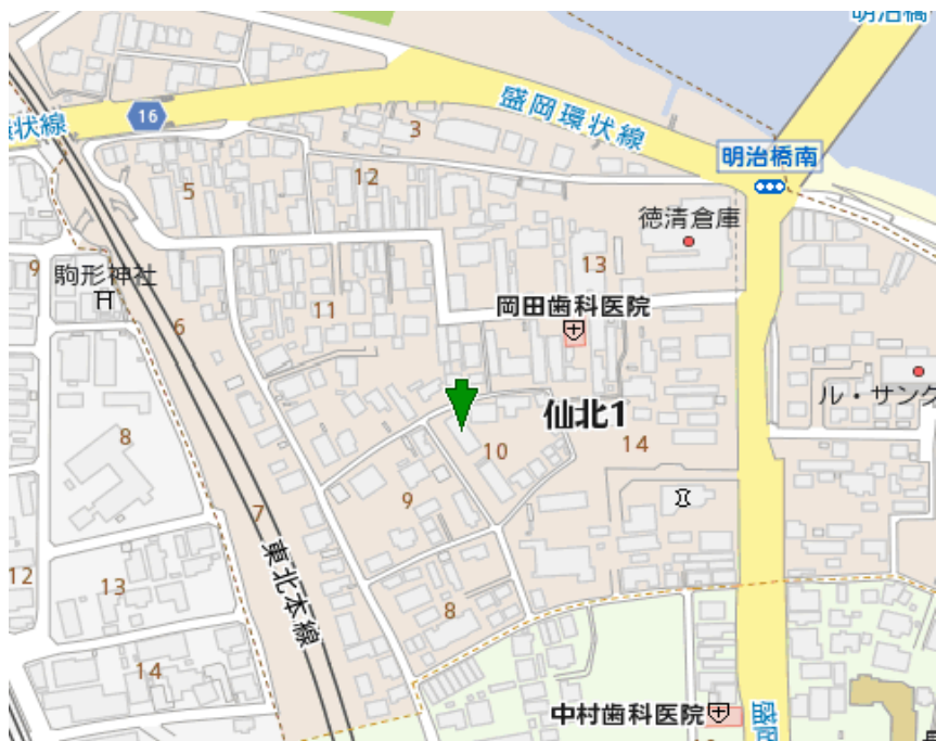
* 図面・写真と現況に相違がある場合は現況を優先します。

家賃の支払いでWAONポイントが貯まります! (契約更新時に一年分のポイントを付与いたします)